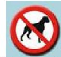
Prohibido el ingreso de animales